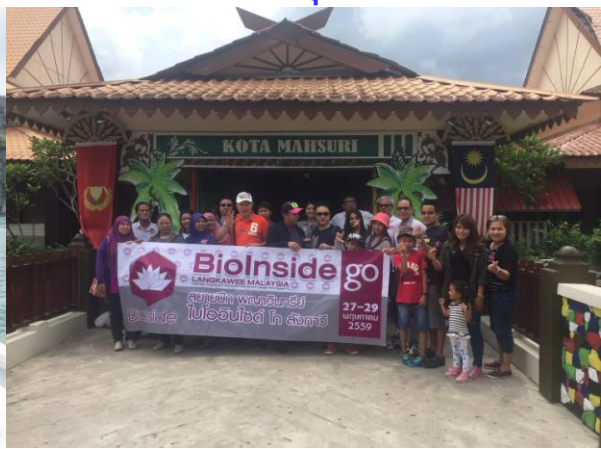
พักที่ ADYA HOTEL LANGKAWI ระดับ 4 ดาว